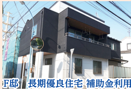
下邸 長期優良住宅 補助金利用