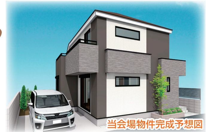
当会場物件完成予想図